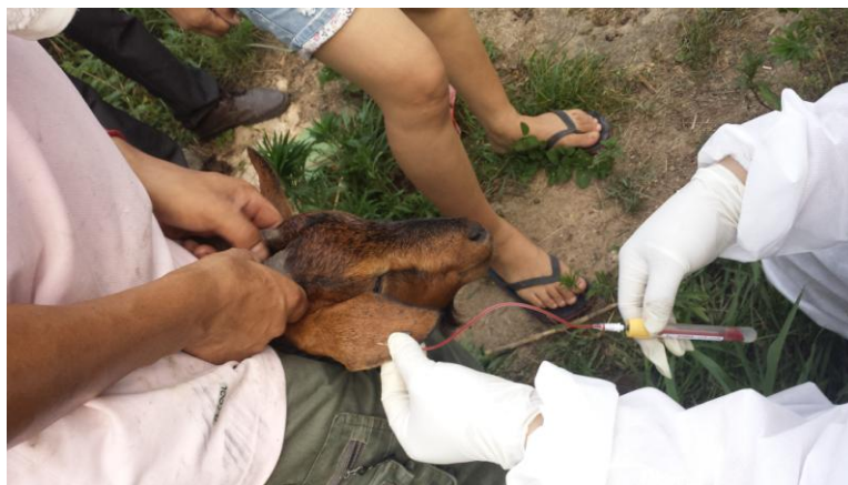
动监部门采集山羊血样标本