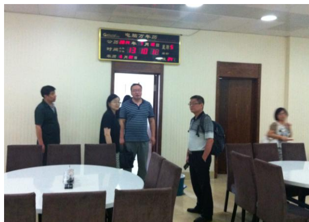
CFETP 项目老师现场考察吉林基地学员的生活条件